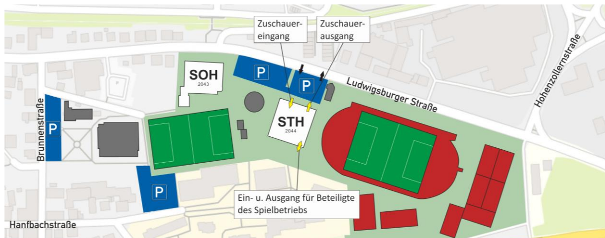
Abbildung 1: Übersichtskarte Stadionhalle Möglingen

Grundsätzlich empfehlen beide Vereine die Nutzung der offiziellen Corona-Warn-App zum Zwecke der Nachverfolgbarkeit.